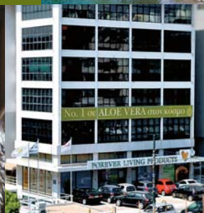
Κεντρικά γραφεία και καπώστημα, Αθήνα, Ελλάδα.