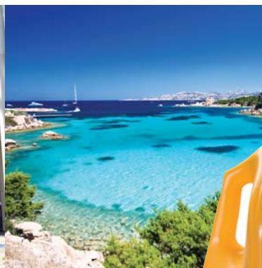
Ταξίδια σε όλο τον κόσμο!