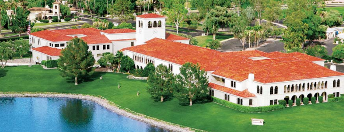
Έδρα - Κεντρικά γραφεία Φοενίς, Arizona Αμερικής.