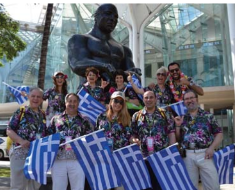
Εθελοντές Συνεργάτες στην Hawaii